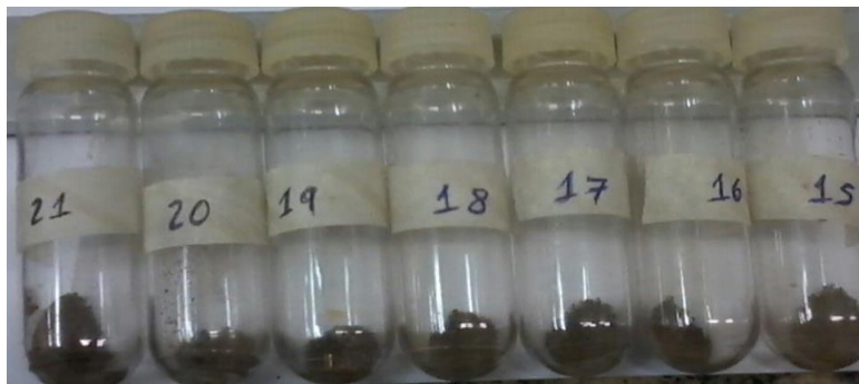
Figura 4. Tubos contendo 1 g de solo antes da extração da PSRG.

realizadas centrifugações a 10000 rpm por 5 min, quando o sobrenadante foi removido para posterior quantificação da proteína (Figura 5). A quantificação da glomalina foi realizada pelo método Bradford (1976), usando-se como padrão a proteína a albumina bovina sérica. Nesse método foi utilizado o corante Comassie Brilliant Blue G-250 (CBB ou Reagente de Bradford), que tem a capacidade de formar complexos com as proteínas da solução causando uma modificação na absorbância, que é equivalente à quantidade de proteína presente (BRADFORD, 1976).