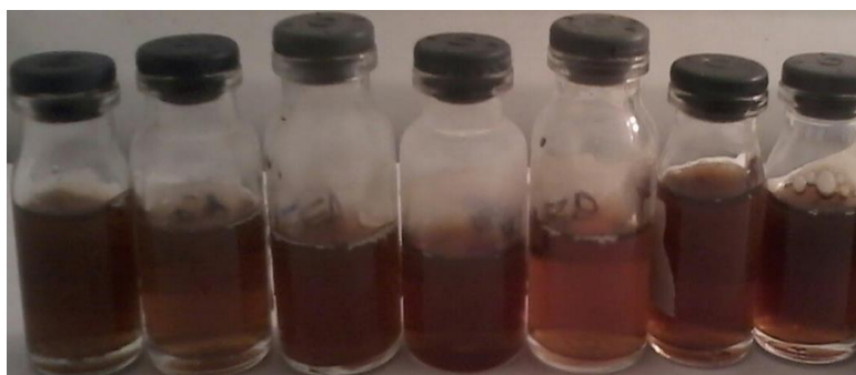
Figura 5. Frascos contendo a PSRG FE no sobrenadante logo após a autoclavagem e centrifugação.