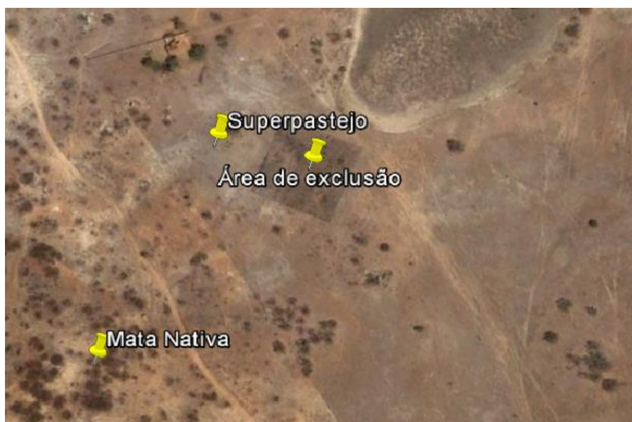
Figura 2. Vista aérea das áreas onde foram coletadas as amostras de solo.

As coletas do solo foram realizadas em três áreas com 0,25 hectares cada (Figura 2) e (Figura 3), e caracterizadas por diferentes níveis de degradação e recuperação, sendo: área de superpastejo, com pouca ou nenhuma vegetação natural e severa presença de erosão laminar; área de exclusão que permanece em processo de regeneração natural, livre da entrada animais domésticos, sendo cercada com nove fios de arame farpado e estaqueadas a cada metro; área de mata nativa, caracterizada por vegetação de caatinga arbustiva-arbórea. Em cada área foram coletadas 07 amostras deformadas de solo, escolhidas por caminhamento em zigue-zague, aleatoriamente e georeferenciadas, a uma profundidade de 0-10 cm.