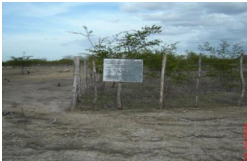
Figura 3: Foto da área experimental – exclusão e sua adjacência (superpastejo)